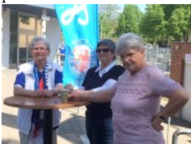
Die drei Damen vom Kuchentisch