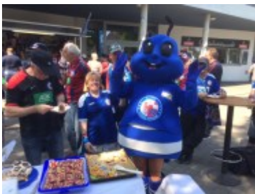
Das Maskottchen beehrte die Fanclub-Aktion persönlich