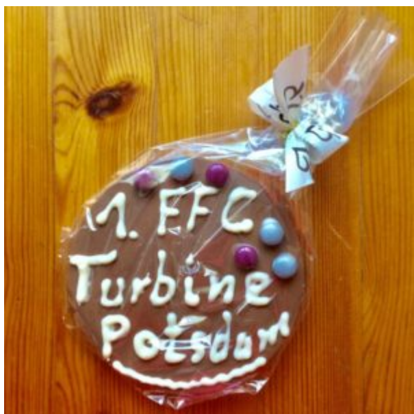
Kreatives Backwerk eines Turbinefans