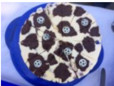
Fußballtorte - gebacken von Otto