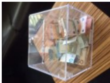
Gefüllte Spendenbox mit 1003,50€:-)