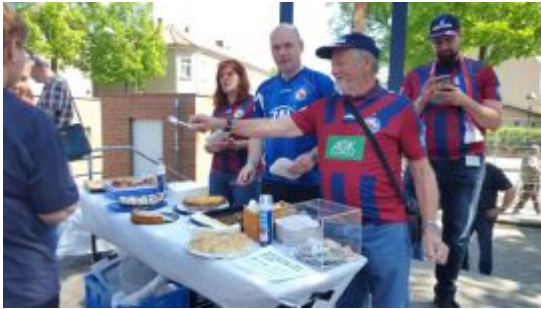
Das Aktion läuft