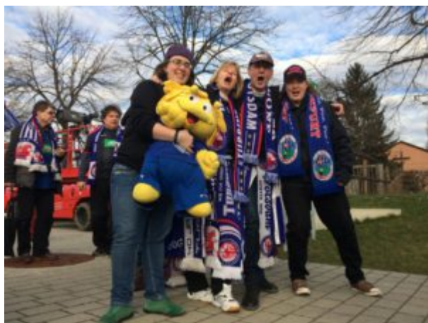
Turbine- und Frankfurter Fans eng vereint (Spiel gegen Frankfurt im Februar 2018)