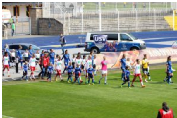
Spiel gegen USV Jena im April 2017