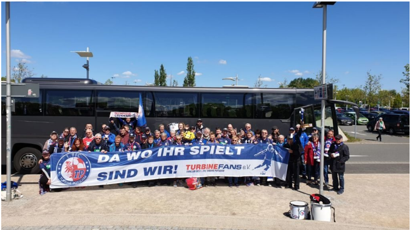
Die Turbine-Fans on tour